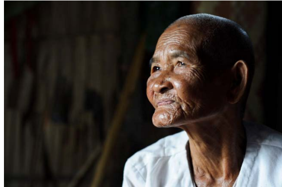
LLAI, 79 AÑOS Y UNAS MANOS LLENAS DE HISTORIA Y DE VIDA.