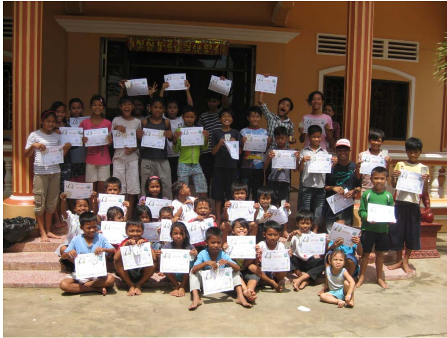
COMO LO HICE MUYYYYYYYYYY BIEN RECIBÍ UN DIPLOMA.