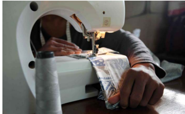
GRACIAS A SPOTLIGHT, EMPRESA AUSTRALIANA, TENEMOS LA OPORTUNIDAD DE CREAR UN TALLER DE COSTURA, DONDE UNAS MUJERES LUCHAN POR ROMPER SU CIRCULO EN LA POBREZA.